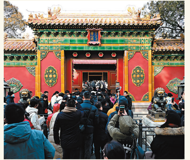
●12月26日，關閉十年的北京故宮博物院養心殿向公眾重新開放。遊客通過養心門進入養心殿。

另外，三希堂因乾隆帝收藏的三幅著名法帖，即王羲之《快雪時晴帖》、王獻之《中秋帖》和王珣《伯遠帖》而聞名天下，同時「三希」也有「士希賢、賢希聖、聖希天」之意，表示一個人要始終不懈追求，勤勉奮鬥，所以三希堂復原的是乾隆時期的原貌。香港文匯報記者在現場看到，三希堂的炕桌上，玉如意、銅