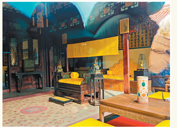
東暖閣 「垂簾聽政」場景布置