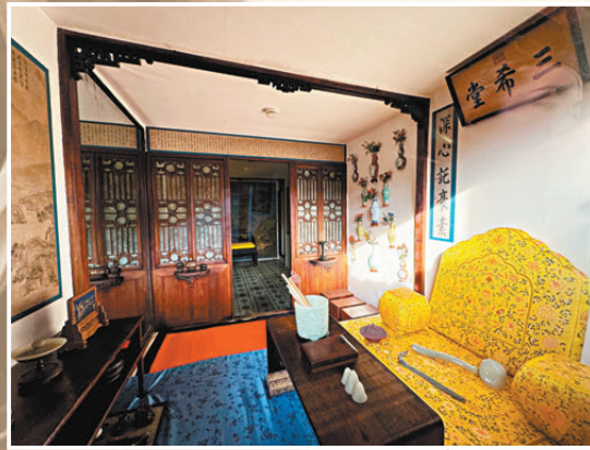
三希堂 乾隆時期陳列場景

在觀眾的視線之外，養心殿亦是新事不斷。科研團隊利用三維掃描技術為所有文物建立數字檔案；清晰記錄下建築殘損風化的痕跡；針對古建展廳光照難題，研究光纖調光系統，在保障文物安全的前提下優化觀眾觀展體驗；磚雕透風內發現的清宮戲摺和金環的來源仍在研究。